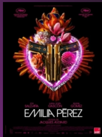
"Emilia Pérez" De Jacques Audiard Drame / 2h10 / 16 ans (16)