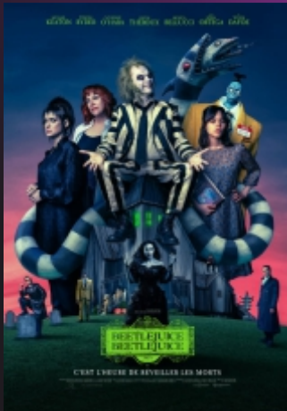
"Beetlejuice Beetlejuice" De Tim Burton Comédie / 1h44 / 10 ans (14)