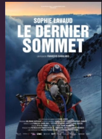
"Le Dernier Sommet" De François Damilano Docu. / 1h27 / âge voir site