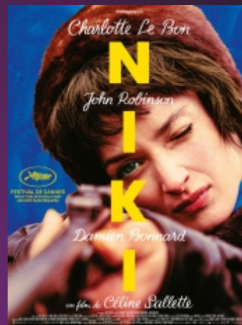
"NIKI" De Céline Scalotte Biogra. / 1h38 / Âge voir site