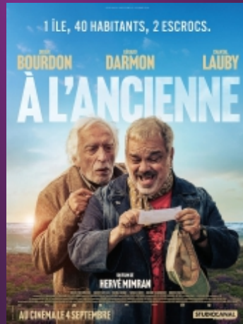
"A l'Ancienne" De Hervé Mimran Comédie / 1h30 / 10 ans (14)