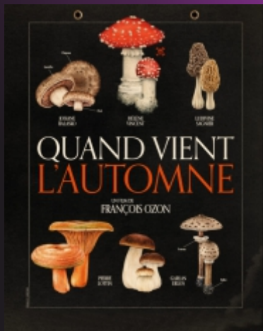
"Quand vient l'Automne" De François Ozon Comédie / 1h45 / Âge voir site