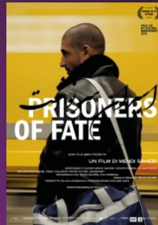
"Prisoners of Fate" De Mehdi Sahebi Docu. / 1h39 / 14 ans (14)