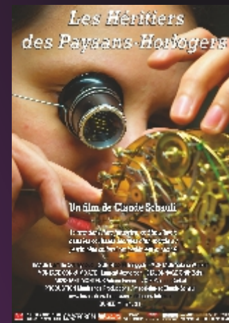
"Les Héritiers des Paysans Horlogers" De Claude Schauli Docu. / 1h11 / âge voir site