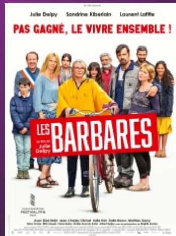
"Les Barbares" De Julie Delphy Comédie / 1h41 / Âge voir site