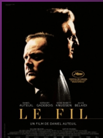
"Le Fil" De Daniel Auteuil Drame / 1h55 / âge voir site